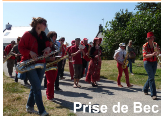
Prise de Bec